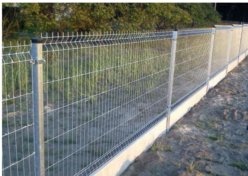
Panel ogrodzeniowy 2W - kolor GRAFITOWY RAL 7024