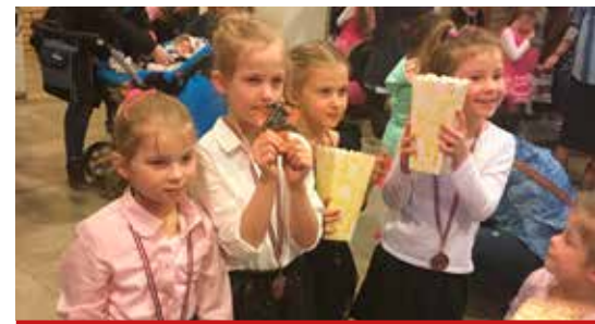
Jeszcze raz, brawo dzieciaki, jesteśmy z Was dumni