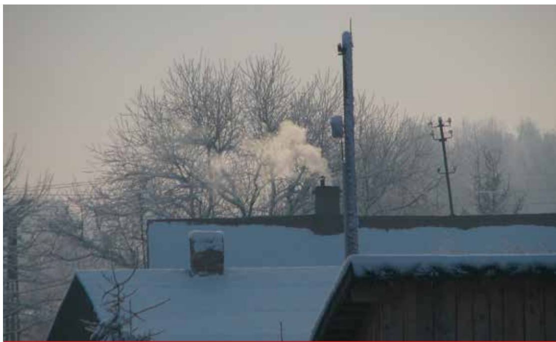
Palenie śmieci w domowych piecach jest wykroczeniem, za które grozi grzywna w wysokości do 5.000 zł.

Przepisy prawa określają, czego nie wolno spalać w piecach domowych i ogniskach: