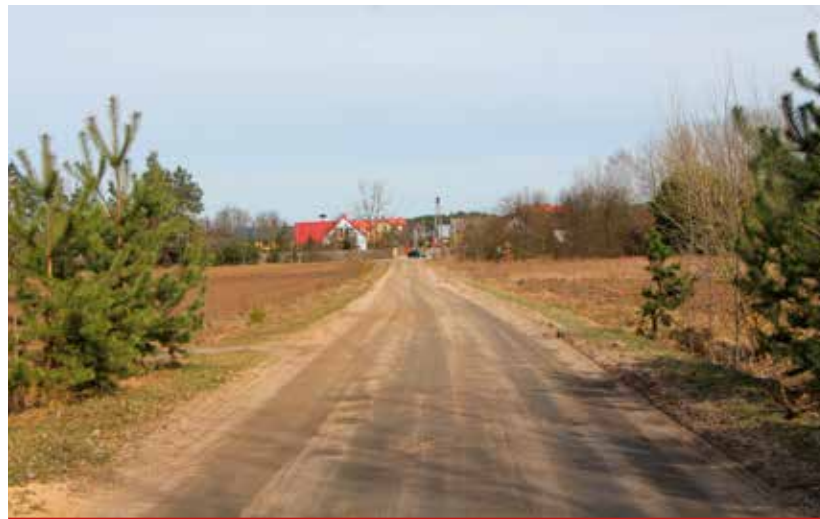
Droga Bojary – Borowskie Cibory będzie miała szerokość 5,5 m, kategorię ruchu KR2 i gruntowe pobocza 2x1,0 m

W ramach inwestycji planowana jest przebudowa drogi nr 106670B do parametrów klasy technicznej D. Dla poprawy bezpieczeństwa zakładamy instalację 60 m barier stalowych ochronnych i wykonanie peronu w obrębie istniejącego przystanku autobusowego przy skrzyżowaniu z drogą powiatową w Borowskich Ciborach. Przejście dla pieszych ma oświetlać drogowa lampa solarna (hybrydowa) przy wspomnianym przystanku. Przebudowa będzie możliwa dzięki dofinansowaniu z budżetu państwa w ramach Programu Rozwoju Gminnej i Powiatowej Infrastruktury Drogowej. We wrześniu 2016 r. Gmina złożyła wniosek o dofinansowanie, który przeszedł pozytywną weryfikację i dzięki temu można liczyć na wsparcie w wysokości 50 % kosztów kwalifikowanych.