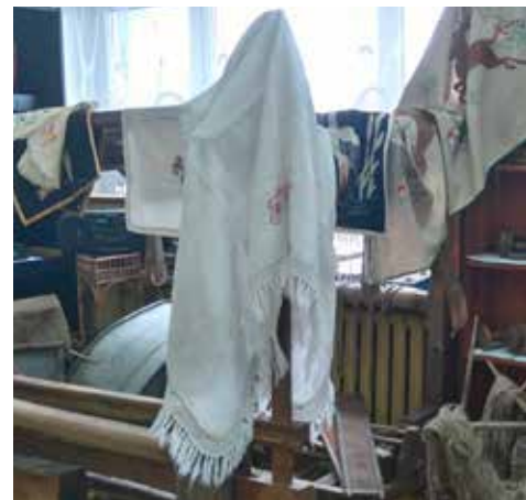
Pobyty w izbie pozwala przenieść się w przeszłość, poczuć jej siłę i twórczą moc