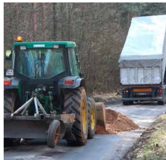
Zima znowu nie oszczędziła nawierzchni naszych dróg. Najgorsze wyłoniło się spod śniegu.

– Stan dróg oceniamy posiłkując się kontrolami, które systematycznie prowadzą pracownicy referatu. Zmienność wiosennej pogody powo-