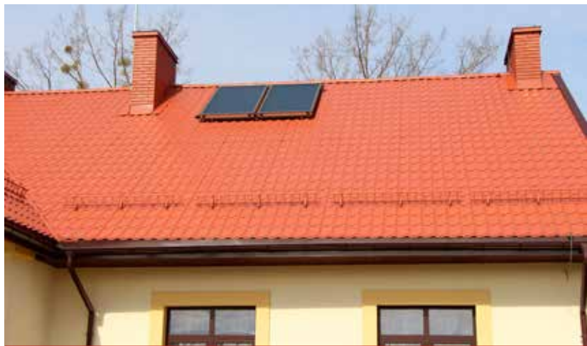
Dostawę ogniw fotowoltaicznych oraz kolektorów słonecznych planuje się zakończyć w połowie 2018 r.

Ogłoszony przetarg na montaż urządzeń OZE