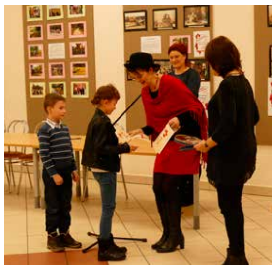
„Miłość może być wieczna, albo szalona” – śpiewała jedna z uczestniczek. Tegoroczne występy były bardzo zróżnicowane, ale wszystkie na tym samym, wysokim poziomie

Jak co roku organizatorem Przeglądu jest Gminny Ośrodek Kultury, który we współpracy ze Stowarzyszeniem Przyjaciół