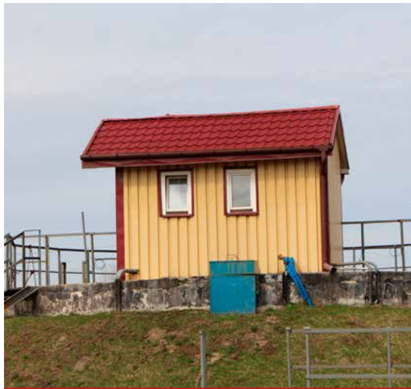
Dzięki przebudowie oczyszczalnia w Turośni Kościelnej zwiększy przepustowość do 400 m 3 /dobę

A pochwalić się tymi planami możemy, ponieważ Zarząd Województwa Podlaskiego ogłosił wstępną listę operacji „Gospodarka wodno-ściekowa” w ramach poddziałania „Wsparcie inwestycji związanych z tworzeniem, ulepszaniem lub rozbudową wszystkich rodzajów małej infrastruktury, w tym inwestycji w energię odnawialną i w oszczędzanie energii” w ramach działania „Podstawowe usługi i odnowa wsi na obszarach wiejskich” objętego PROW na lata 2014-2020. Wynika z niej że, Gmina Turośń Kościelna uzyskała dofinansowanie na zadanie pn. Modernizacja oczyszczalni ścieków w Turośni Kościelnej oraz budowa studni w Baciutach. Wartość dofinansowania ma wynieść 1.999.997 zł.