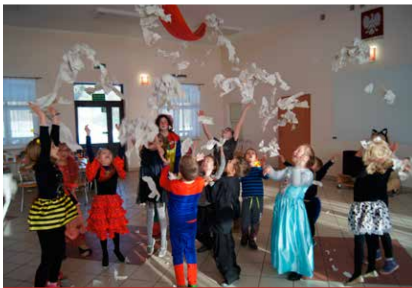
„W czasie deszczu dzieci się nudzą”, to ogólnie znana rzecz. Ale nie dla nas. Nasze dzieci nie nudzą się, ani w deszczu, ani zimą. Sami spójrzcie, czy nam może nie być wesoło