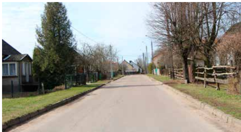
Przy ulicy w Pomigaczach powstanie nowy chodnik

Planujemy także kontynuować budowę chodnika wzdłuż ul. Lipowej w Turośni Kościelnej. W 2016 r. wykonaliśmy 300 m od skrzyżowania z ul. Białostocką. Brakujące 700 m zamierzamy zrealizować w bieżącym roku. Zgodnie zeszłoroczną zasadą, Powiat Białostocki zapewni materiały budowlane, a Gmina wykona niezbędne roboty i będzie sprawować nadzór inwestorski.