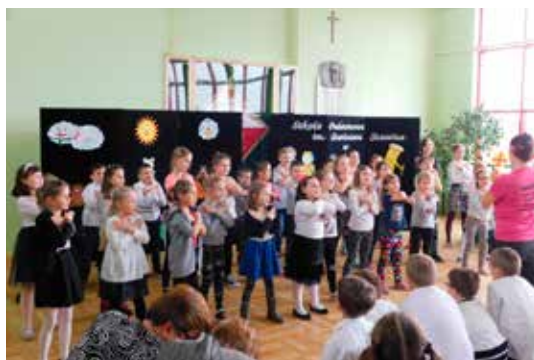
Szkolna grupa taneczna „Zumba” porywała wszystkich do wspólnej zabawy. W tanecznym rytmie zwiedziliśmy Szkołę