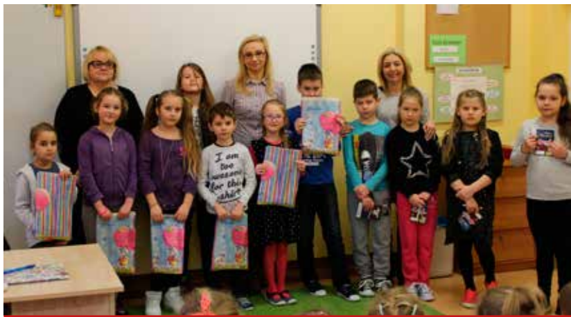
Rywalizacja w opowiadaniu polskich legend dostarczyła wielu emocji nie tylko startującym w konkursie dzieciom, ale także i słuchającym