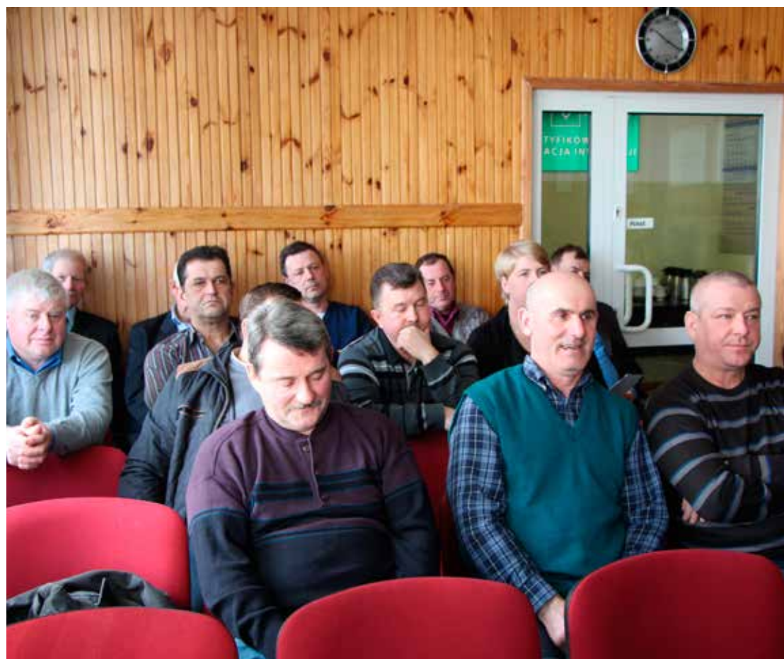
W obradach XXII Sesji Rady Gminy uczestniczyli również sołtyś z naszego terenu

Treść wszystkich uchwał podjętych w ramach XXI i XXII Sesji Rady Gminy Turośń Kościelna zamieszczona jest na stronie Biuletynu Informacji Publicznej Gminy Turośń Kościelna.