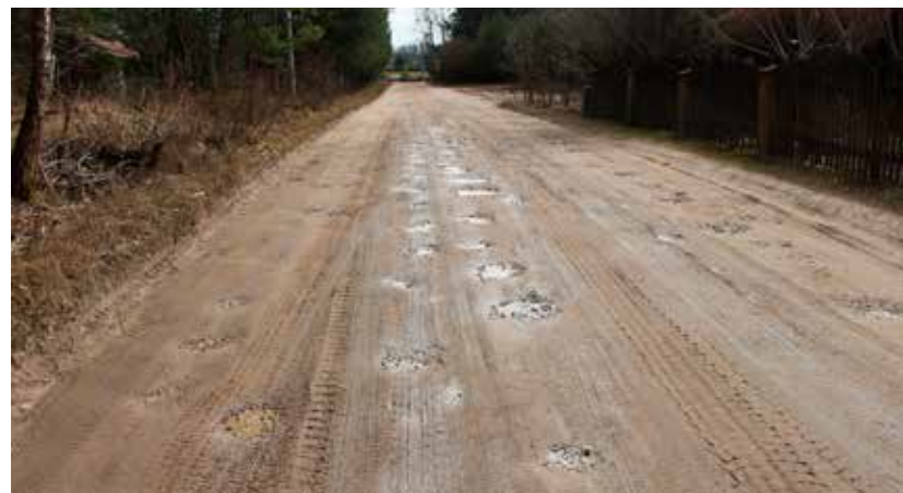
Ulica Topole w Niewodnicy Kościelnej czeka na przebudowę